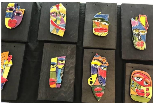
6. klasse udstiller i Aulaen

En begivenhedsrig måned ligger nu bag os, og vi kan se tilbage på gode oplevelser for såvel små som store på vores friskole.